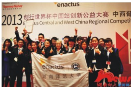
创行团队选手合影

【我校创行团队获全国三等奖】 5月16日至17日，2013创行世界杯中国站创新公益大赛在北京举行。我校创行团队以中西部区域赛小组第二名的身份参加全国赛，并荣获全国赛三等奖的佳绩。创行是一个全球性的以在校大学生为主体的商业实践社团，共涉及全球38个国家近1600所学校。我校创行团队成立于2010年10月31日，是中国最年轻的创行团队之一，现有成员42名。（梁海蛟 朱佳艳）