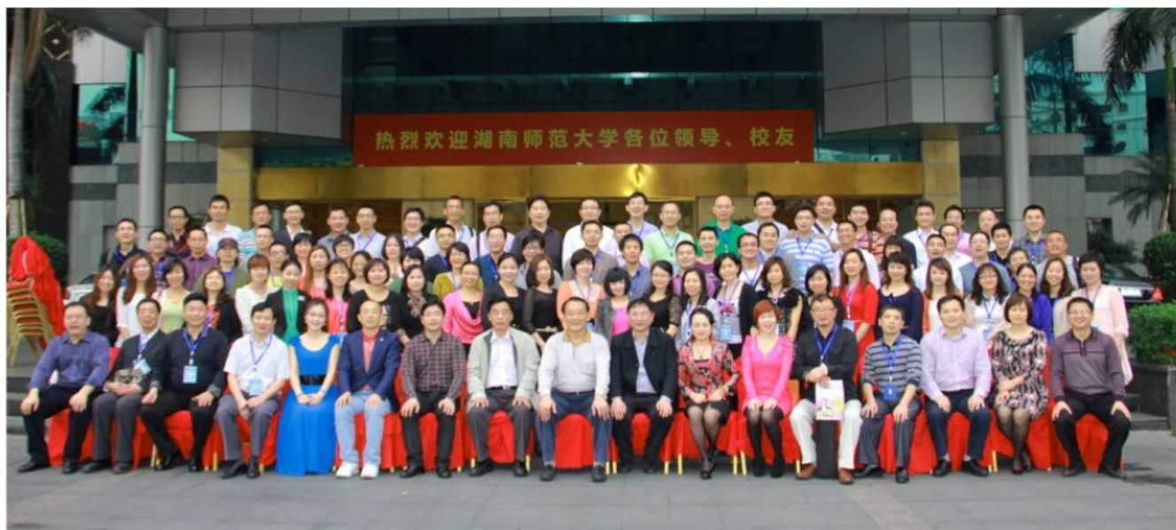
第一届湖南师大广东校友联谊会理事会合影