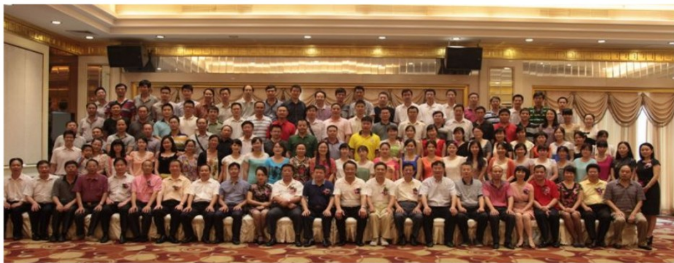
湖南师范大学惠州校友分会成立大会出席人员合影