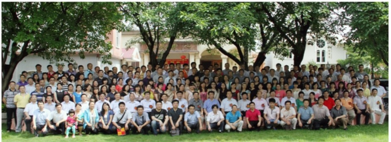
韶关校友分会成立大会出席人员合影