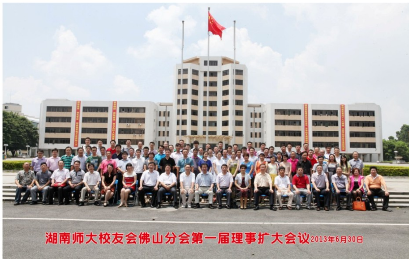
佛山校友分会第一届理事扩大会议全体人员合影