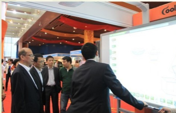
广东省教育厅领导考察公司产品