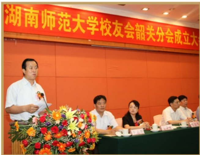
韶关市副市长邹永松同志讲话