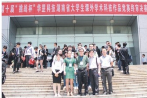
参赛选手与老师合影

【参赛“挑战杯”获团体总分第二名】第十届“挑战杯”湖南省大学生课外学术科技作品竞赛终审决赛于5月12日落下帷幕。我校参赛的15件作品全部获奖，并以团体总分第二名的优异成绩捧得“优胜杯”。其中，荣获特等奖1个、一等奖6个、二等奖6个、三等奖2个。我校教育科学学院谭鑫等同学的社科类作品《不能承受的心理之重——临床医生心理和谐现状及其心理研究》获特等奖。（白芸）