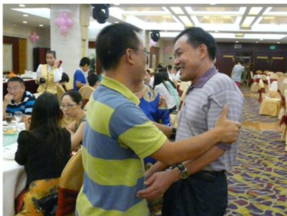
校友相见，格外亲切